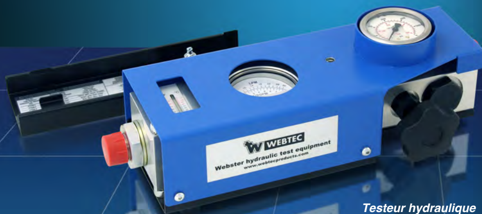
Testeur hydraulique mécanique RFIK

L'appareil de test offre au technicien d'entretien un équipement de test rapide, précis, simple et performant pour les pompes, moteurs, vannes, vérins et circuits hydrauliques complets.